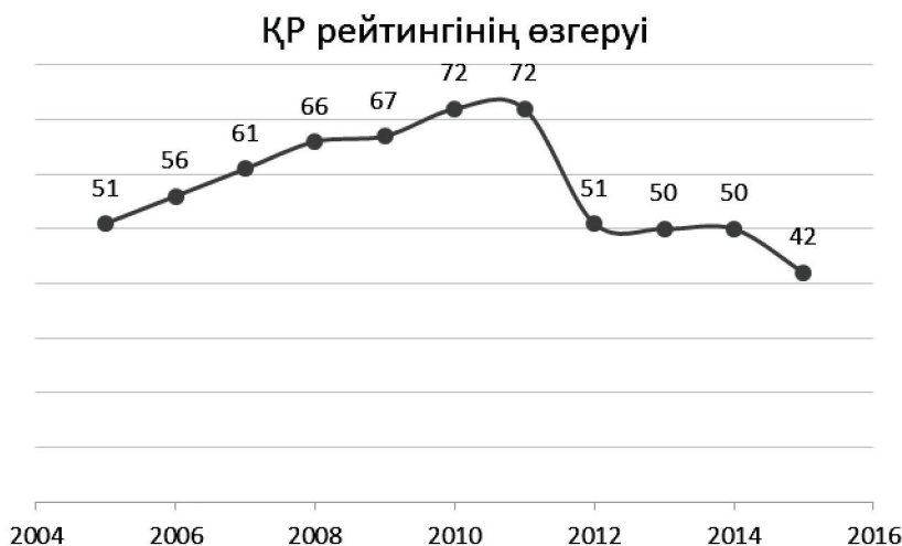
1-сурет. ҚР рейтингінің жылдық өзгерісі.

2015 жылғы 30 қыркүйекте Дүниежүзілік экономикалық форум 2015-2016 жылдарға арналған Жаһандық бәсекеге қабілеттілік туралы жыл сайынғы есепті жариялады. Әлемдегі бәсекеге барынша қабілетті үш ел: Швейцария (1), Сингапур (2) және АҚШ (3).