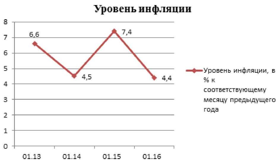
Рис.3 Уровень инфляции за 2013-2015 Источник: [12]

Произошло ускорение инфляционных действий, вследствие повышения цен на импортируемые товары, а также девальвационных ожиданий, усилившихся в результате снижения мировых цен на нефть сорта Brent. По результатам 2014 года, уровень инфляции составил 7,5% в рамках целевого коридора 6-8%.