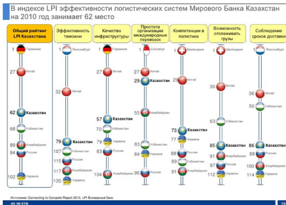
Рисунок 1. Эффективность логистических систем

Китай, являясь мировым производителем товаров и услуг, будет иметь полный кон-троль над движением товаров в пути, так как он будет иметь отношения со странами с од-ной и единой таможенной и нормативно-правовыми актами. Казахстану это поможет увели-чить грузопоток на 155%. Казахстан также обладает несравнимыми преимуществами в области ставки НДС, где он является 12%, а у наших соседей Беларуси 18%, в России 20% . Тем самым страны импортеры смогут «очистить» товары в Казахстане для дальнейшего распределения в страны Таможенного союза.