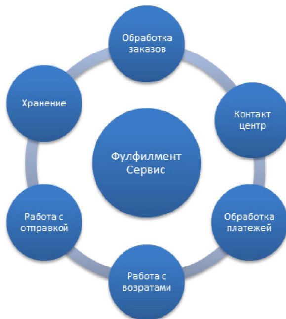
Рисунок 4. Работа системы фулфилмента