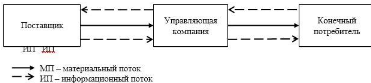
Рисунок 1. Прямая цепь поставок

Материальные потоки на предприятии, движущиеся от поставщиков к потребителям, создают цепь поставок. Управление цепью поставок требует создание эффективной функции менеджмента на всем протяжении его цикла. Рассмотрим на рисунке 1. прямую цепь поставок на предприятии.