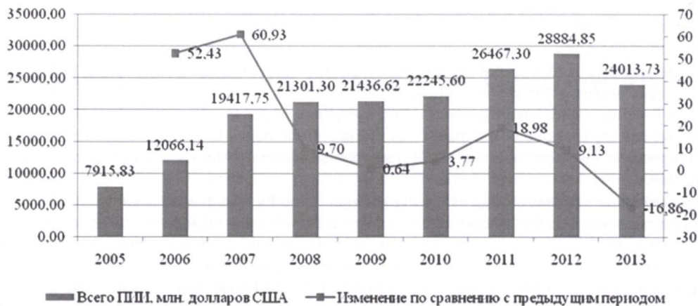
Рисунок 1. Валовой приток иностранных прямых инвестиций в РК от иностранных прямых инвесторов за 2005-2013 гг.

В анализируемом периоде наблюдается постоянный рост ППИ с 2005 до 2012 год. Так, наибольший приток приходится на 2007 год - по сравнению с прошлым годом увеличение составило 60,93%. Наименьший прирост наблюдается в кризисный 2009 год - 0,64%. Однако это не самое худшее значение, так как в 2013 году ППИ в первые за 10 лет ППИ уменьшились на целых 16,86%.