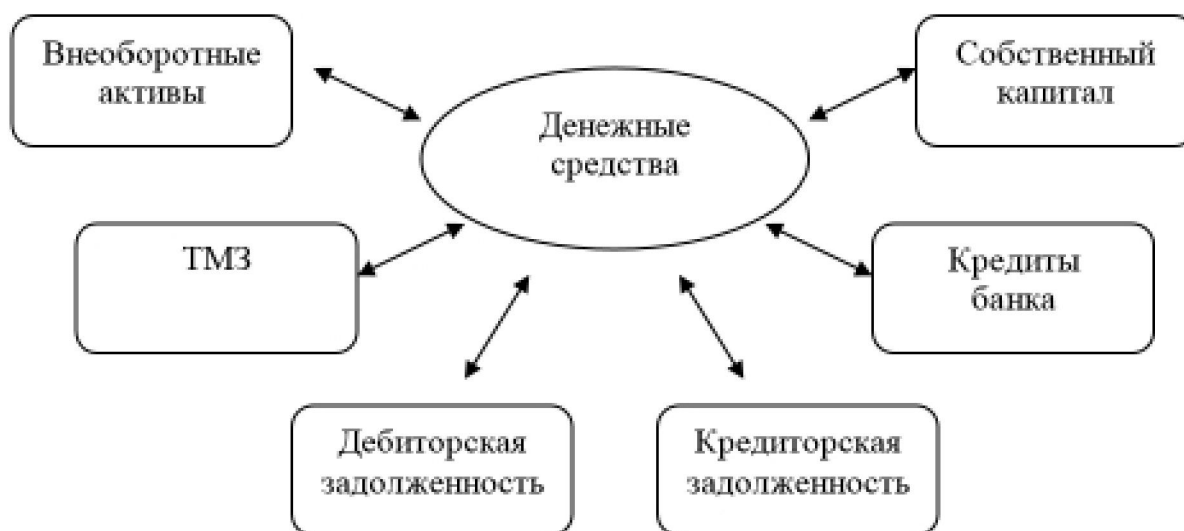
Рисунок 2. Управление денежными потоками организации [3]

При комплексном подходе к управлению потоками денежных средств организации решается основная задача, характеризующаяся: