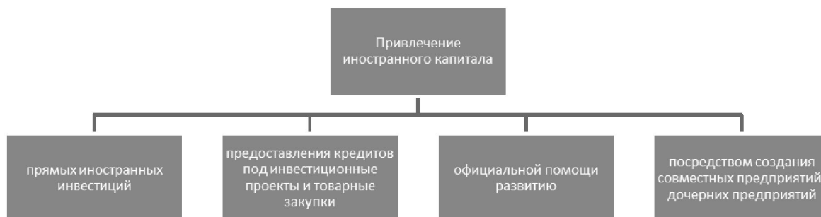
Рисунок 1. Привлечение иностранного капитала