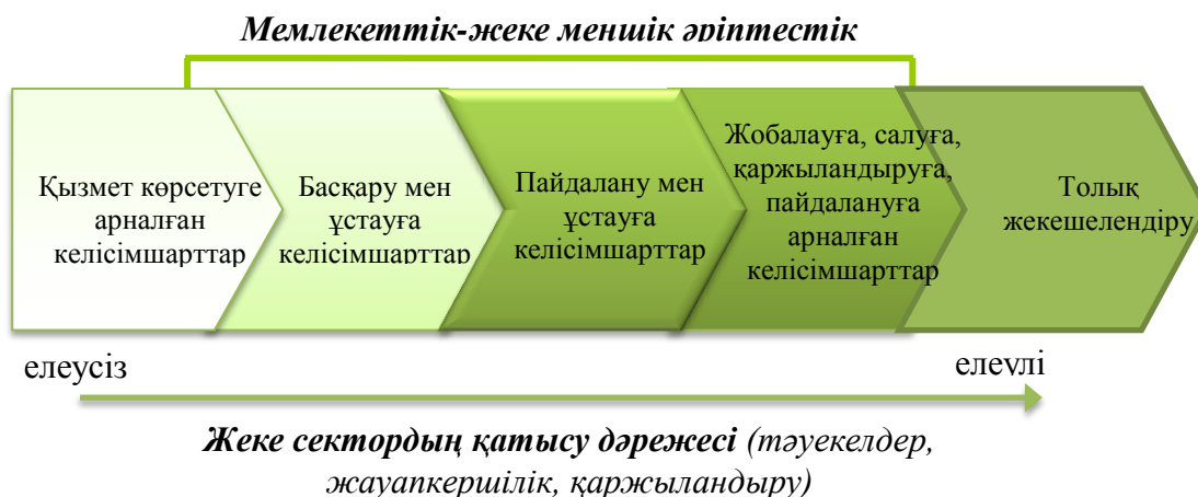
Сурет 1. Дүниежүзілік банктің әдіснамасына сәйкес МЖӨ келісімшарттарының түрлері

3. Жобалауға, құрылыс салуға, қаржыландыруға және пайдалануға арналған келісімшарттар: