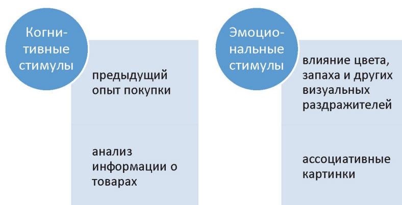
Рисунок 1. Стимулы, оказывающие влияние на процесс покупки

При помощи исследования когнитивного и эмоционального отклика потребителя на поданную информацию, компания может управлять поведением потребителей и, в конечном итоге правильно выстраивать маркетинговую стратегию, которая приведет к увеличению продаж. В Республике Казахстан такие исследования не проводятся, но имеются аналоги на западном рынке, где специалисты при использовании МРТ, томографов и другой техники могут анализировать разные участки мозга. В основном, полученные результаты анализа используются для создания рекламных сообщений. В целом влияние когнитивного и эмоционального воздействия при принятии решения о покупке можно представить схематично (рисунок 1).