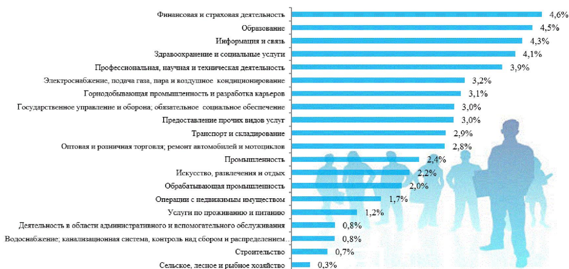
Рисунок 3. Число выпускников вузов 2014 года, принятых на работу по сферам занятости в 2016 г [3]

Тем не менее статистика по трудоустройству показывает, что очень низкий процент из них находят работу по своей специальности: