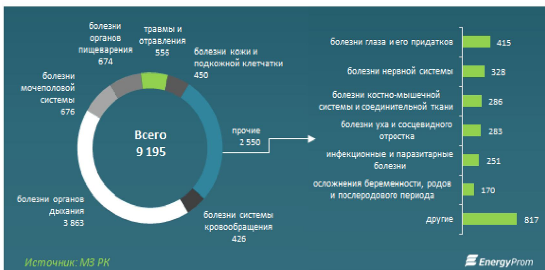
Рисунок 4. Структура заболеваемости в РК в 2016 г [4]

- ввиду того факта, что первостепенным назначением налога на загрязнение природной среды является достижение сокращения вредного воздействия и снижения экологической нагрузки на окружающую среду Казахстана, соответствующим преимуществом, получаемого обществом будет улучшение показателей здоровья нации. Обеспечение высокого уровня благосостояния и здоровья нация всегда являлось и остается главной ценностью любого государства, так как к процветанию и развитию государства, укреплению его позиций на мировом рынке способно привести только здоровое население. В настоящий момент, для Казахстана является критическим вопрос о снижении показателей заболеваемости, вызванной плохой экологией, так как данные цифры имеют тенденцию к стремительному росту. За последние годы резко повысилась доля людей в городах Казахстана, лидирующих по показателям загрязненности окружающей среды, такие как Шымкент, Алматы, Усть-Каменогорск, Павлодар, которые страдают раковыми заболеваниями и болезнями дыхательных путей, сердечно-сосудистой системы, кожного покрова. Более подробно продемонстрировать масштабы последствий негативного воздействия экологии поможет следующая статистика заболеваемости по всей стране: