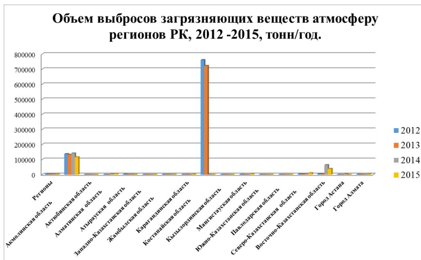
Рисунок 2. Объем выбросов загрязняющих веществ атмосферу регионов РК, 2012 -2015, тонн/год

Твердые взвешенные вещества, включает много различных компонент. В него входят пыль, зола, сажа, дым, сульфаты, нитраты и другие твердые составляющие, образуются в результате сгорания всех видов топлива и при производственных процессах. Симптомы при отравлении сернистым газом — насморк, кашель, охриплость, сильное першение в горле и своеобразный привкус. При вдыхании сернистого газа более высокой концентрации — удушье, расстройство речи, затруднение глотания, рвота, возможен отёк лёгких. При кратковременном вдыхании оказывает сильное раздражающее действие, вызывает кашель и першение в горле. Угарный газ очень опасен, так как не имеет запаха и вызывает отравление и даже смерть.