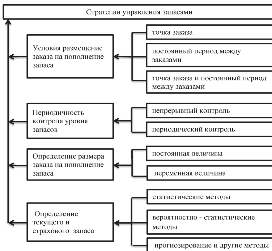
Рисунок 2. Формирование стратегий управления запасами [3]

Помимо определенных этапов формирования запасов рассмотрим критерии, по которым можно определить выбор стратегии управления запасами. К таким критериям относят характеристики спроса, стабильность, частота возникновения и равномерность. Также к критериям соотносят характеристику материальных ресурсов, его стоимость, требования к хранению и транспортировке, ценность для потребителя. Характер времени выполнения заказа, состав ограничений на осуществление заказа, на периодичность подачи заказов, на складские и производственные мощности и финансовые ограничения также влияют на выбор стратегий управления запасами.