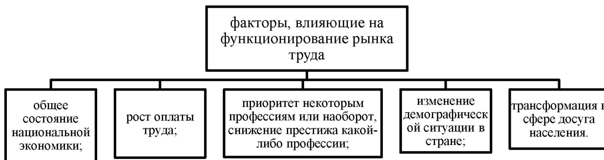
Рисунок 2 – Факторы, влияющие на функционирование рынка труда

Сегодня существует несколько основных моделей реализации рынка труда в рамках государства.