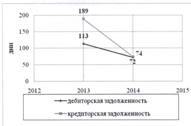
График 1: Соотношение скорости оборачиваемости дебиторской и кредиторской задолженностей в днях.

Оценка состояния дебиторской и кредиторской задолженностей позволяет сделать следующий вывод: период погашения кредиторской задолженности на 2 дня больше, чем дебиторской, что объясняется превышением суммы кредиторской задолженности над дебиторской на 55,6 млн.тенге.